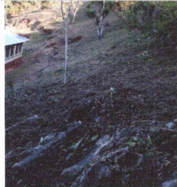
FOTO 4: Se observa lindero del terreno de la escuela que no cuenta con muro