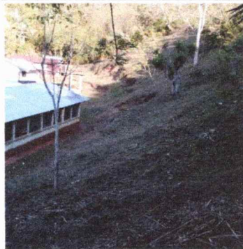
FOTO 5: Se observa lindero del terreno de la escuela que no cuenta con muro