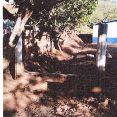
FOTO 2: Se observa parte del muro perimetral deteriorado e incluso